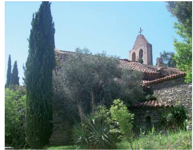
Ermita Santa Magdalena