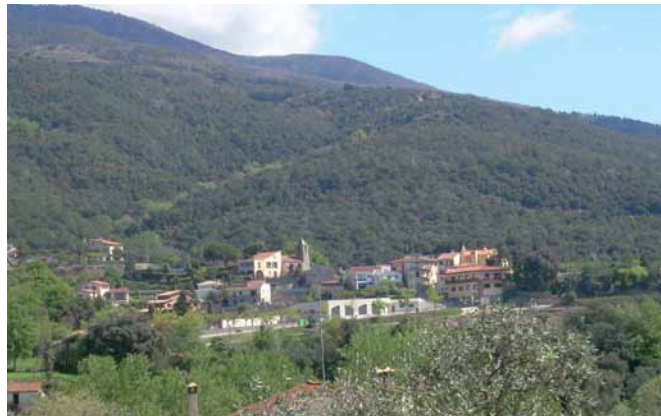
Vistes de Mosqueroles

Seguim la pista principal, deixant camins i masies a dreta i a esquerra, es demana el màxim respecte pels camps i el bestiar, fins a un trencall ( 15 min, 1.500 m, 230 m alt. ) agafem el de la dreta donant la volta a uns camps. 2.100 m cruïlla, continuem per la pista principal deixant el camí de la dreta. Seguim la pista principal deixant trencalls clarament secundaris a dreta i esquerra. Podem gaudir de magnífiques vistes al massís del Montseny, i a la vall de Mosqueroles.