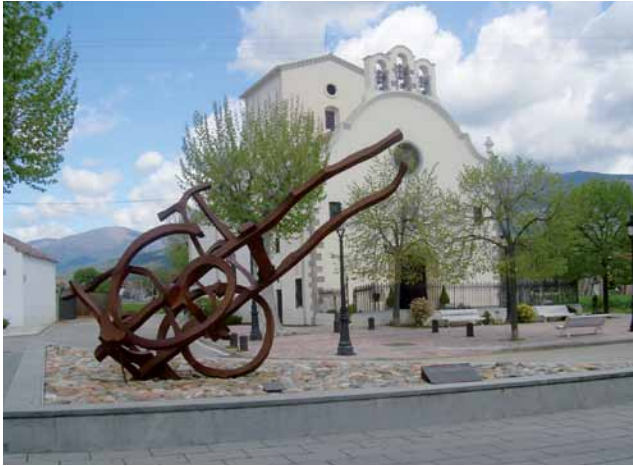
l'Ermita del Remei

Creuem la Tordera ( 1h 30 min, 8.500 m, 220 m alt. ) i pugem fins al pavelló d'handbol de Sant Esteve ( 1h 33 min. 8.700 m 240m alt. ), girem a l'esquerra per passar per davant i agafem el camí de l'esquerra, per anar retornant a