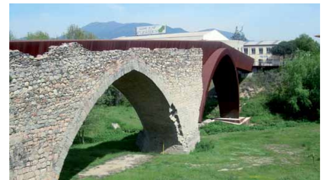
El Pont Trencat

A uns 3 quilòmetres de la sortida trobem la Tordera ( 31 min, 180 metres d'alçada ). El riu no l'hem de creuar. Hi ha un trencall poc visible a la dreta, l'agafem. Fa un fort pendent fins arribar a can Carrerons ( 3.600 m, 37 min, 220 metres d'alçada ). Prenem la pista a l'esquerra, per arribar-nos a can Rafalet ( 4.000 m, 40 min ). Continuem baixant i al poc tros trobem un trencall que continua recte, la pista marxa a la dreta, agafem el trencall i abans d'arribar a la masia girem a l'esquerra. Seguim aquesta pista principal, deixant trencalls a dreta i esquerra fins arribar al barri de Moixerigues ( 5.200 m, 54 min ). Entrem al barri i girem pel primer carrer a l'esquerra (carrer Mosqueroles) i el continuem fins al final on tombem a l'esquerra per un camí cimentat que baixa fins a la Tordera ( 5.500 m ). Creuem el riu per una passera, i seguim el camí, a uns 500 metres trobem el riu sec, que es travessa per una passera. Aquí tenim l'opció de tornar ja cap a Palau (veure itinerari més endavant) o a poc més de mig quilòmetre trobarem el Pont Trencat, si decidim anar-hi continuem el camí fins el barri del Sot de les Granotes, entrem a Sant Celoni ( 6000 m. ), passem pel c/ Francesc Moragues a la dreta i al cap de poca estona ens queda un túnel davant, passem per sota la via del tren i a continuació sota de la carretera, seguim el camí i trobem el Pont Trencat ( 6300 m. 1h 07 min. ).