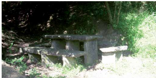
La Font Fresca

Als 1.000 metres de recorregut ( 10 min ), agafem el trencall de la dreta, per travessar les vies de l'AVE ( 1600 m, 16 min ). Passades les vies trobem un trencall i girem a l'esquerra, baixem de manera paral·lela a les vies i abans d'acabar la baixada trenquem per la pista que ens surt a la dreta. Deixem la plana del Reguissol i ens enfilem cap a can Pagà ( 2.000 m de recorregut, 20 min, 240 alt. ). No hem d'entrar a l'asfalt. Just arribar a la urbanització trobem una pista a l'esquerra, la seguim pel mig d'un bosc d'alzines fins que entrem a la finca particular de cal Porro; abans d'arribar al mas trobem un camí a la dreta i ens endinsem al bosc ( 2.600 m, 26 min ). Als 28 minuts trobem la Font Fresca, amb una taula de pedra i bancs, que conviden a un petit descans.