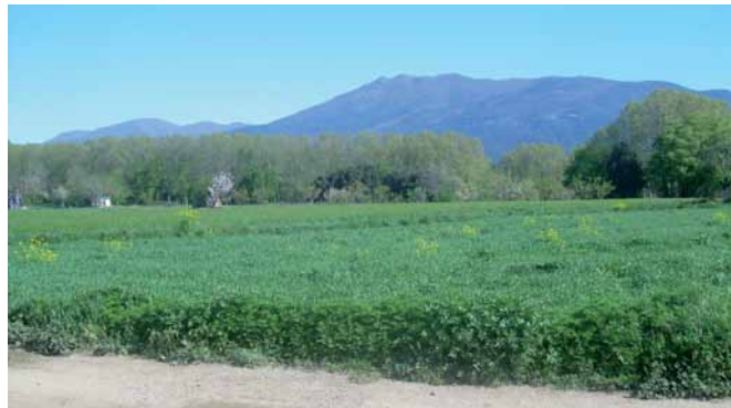
Vistes del Montseny

Sortim de la plaça de la Vila pel carrer Consolat de Mar i continuem per la rambla dels Països Catalans fins al final on girem a la dreta pel carrer Ramon i Cajal. Creuem el pont del Reguissol i a uns 600 metres de la sortida ( 6 min ) trobem una pista que surt a l'esquerra, l'agafem, anem entre camps de conreu.