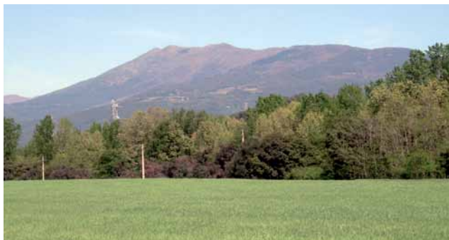
De camí a La Serra

Sortim de la Font dels Enamorats en direcció a Palautordera i abans d'arribar al carrer trobem un camí a l'esquerra entre pollancre, paral·lel al riu. El seguim fins trobar un pont a l'esquerra ( 7.600 m, 1h 20 min ), el creuem i pugem per l'altre vessant del riu. Just acabada la pujada agafem una pista a la dreta i seguidament un trencall a l'esquerra. Passem per davant del Pedrenyal Nou i continuem cap al Pedrenyal. Just abans d'entrar als terrenys de la masia girem a la dreta i continuem en direcció al poble, entre camps que ens permeten unes vistes precioses del Montseny ( 8.300 m, 1h 30 min ).