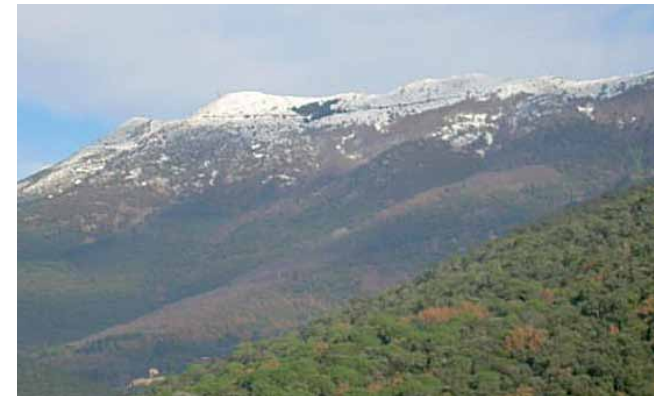
Vistes del Turó de l'Home nevat

m alt.) Seguim el camí, paral·lel a la via del tren, deixem uns trencalls a la dreta i ens enfilem, deixant un trencall a l'esquerra, entrant en el terme de Llinars de Vallès, per anar a passar per un pont per sobre la via de l'AVE (6.000 m, 1h 10 min). Just passat el pont tombem per la pista de l'esquerra per seguir pujant. Deixem diversos trencalls, clarament secundaris, a l'esquerra. A dalt del coll girem a la dreta cap al "Turó de les Formigues" (6.500 m, 1h 20 min, 270 m alt.) Seguim la pista principal deixant trencalls a dreta i esquerra, fins al final de la pista (8.000 m, 1h 40 min) on anem a la dreta, en direcció a la urbanització can Ram (hi ha una senyalització que ho indica). Al cap de poca estona entrem a la urbanització de Can Ram (8.300 m), pel c/ Rosa Sensat, el seguim, i girant a la dreta pel c/ Ferran Soldevila i seguidament a l'esquerra pel c/ Dr. Trueta que seguim fins al final per continuar recte pel c/ del Pi (si agaféssim el c/ del Pi a l'esquerra ens duria fins a Sant Antoni de Vilamajor en poca estona) (9.200 m, 1h 55 min). Caminem fins a torçar a l'esquerra pel carrer Alzina, seguint l'indicatiu de "sortida a Vallserena". Al final del carrer seguim la pista asfaltada (9.600 m, 2h 10 min), on podem veure magnífiques vistes del turó de l'Home i de la vall de la Tordera.