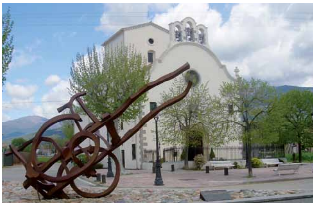
l'Ermita del Remei

respecte pel bestiar i els camps de conreu, fins arribar a una cruïlla, seguim recte, passem entre una casa i un pati i anem a parar a Can Barceló (12.900 m, 2h 40 min, 230 m alt.) Travessem la urbanització recte, fins al pont que creua el torrent Reguissol, seguim per pista asfaltada fins creuar la carretera de Sant Esteve. La creuem i seguim rec-