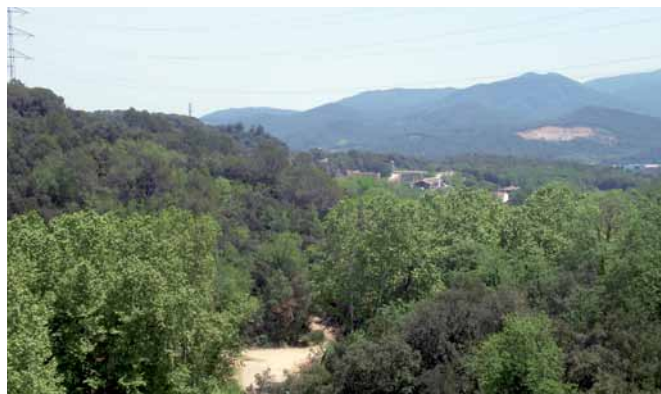
Vistes del masís del Montseny des de la Serra Llarga